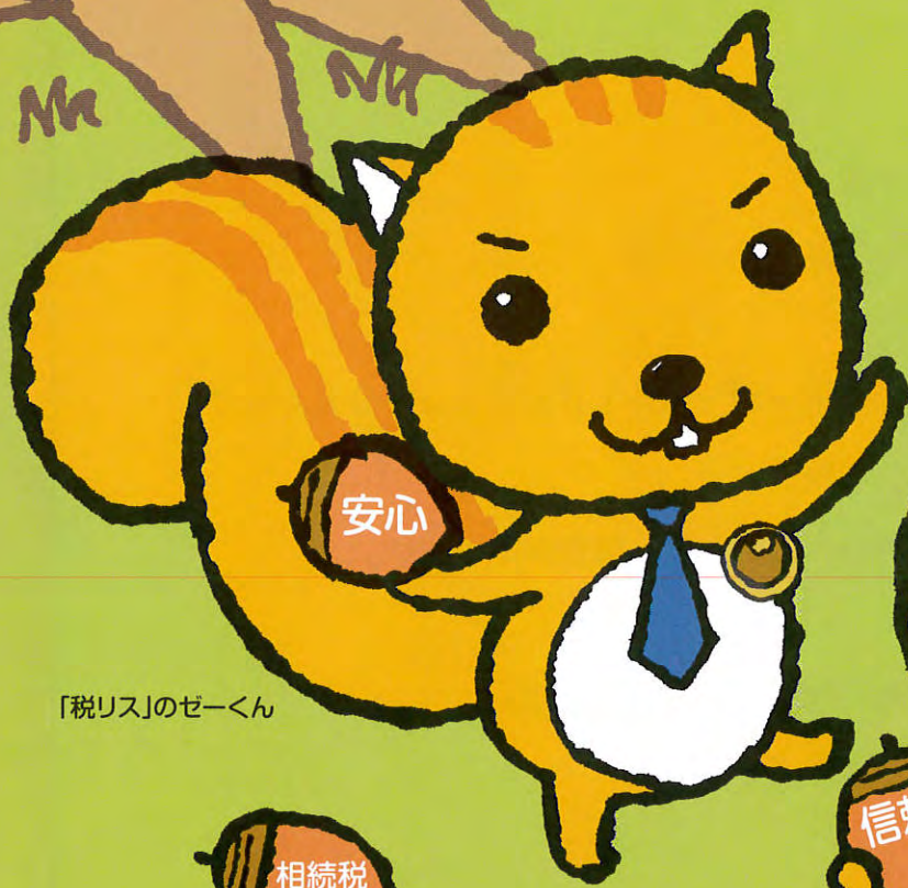
「税リス」のせーくん