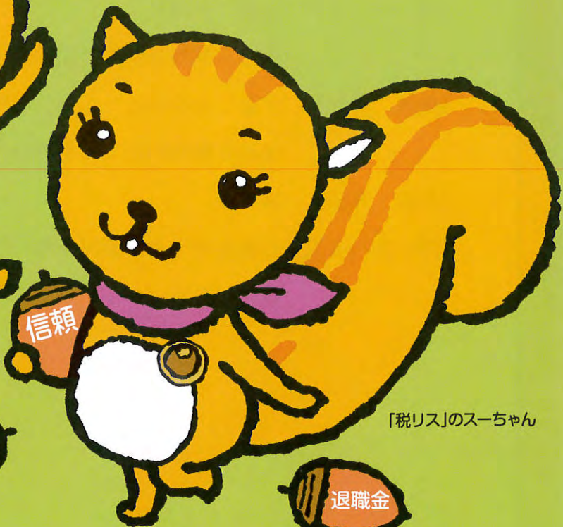
「税リス」のスーちゃん